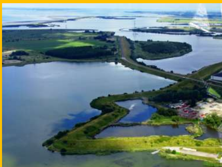
Luchtopname anno 2010 Waterschans ingeklemd tussen Binnenschelde en Noordland. De dam tussen Binnenschelde en Zoommeer leidt naar de Molenplaat

Bergen op Zoom bezit met deze schans een vestingwerk van historisch belangrijke waarde.